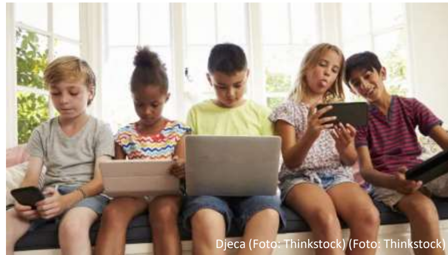
Djeca (Foto: Thinkstock) (Foto: Thinkstock)

Dijete koje posjeduje ovu vještinu, razumije pojam osobnih podataka, zna da svoje osobne podatke ne smije dijeliti online (bez dopuštenja i kontrole odrasle osobe) te razumije kako time štiti svoju privatnost, ali i kako poštivanjem tuđih osobnih podataka štiti tuđu privatnost.